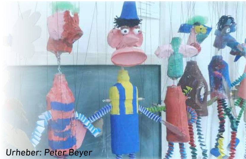
Urheber: Peter Beyer